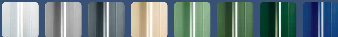
RAL 9010 Blanc